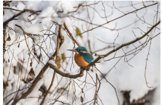
Eisvogel: Vogel des Jahres 2026.